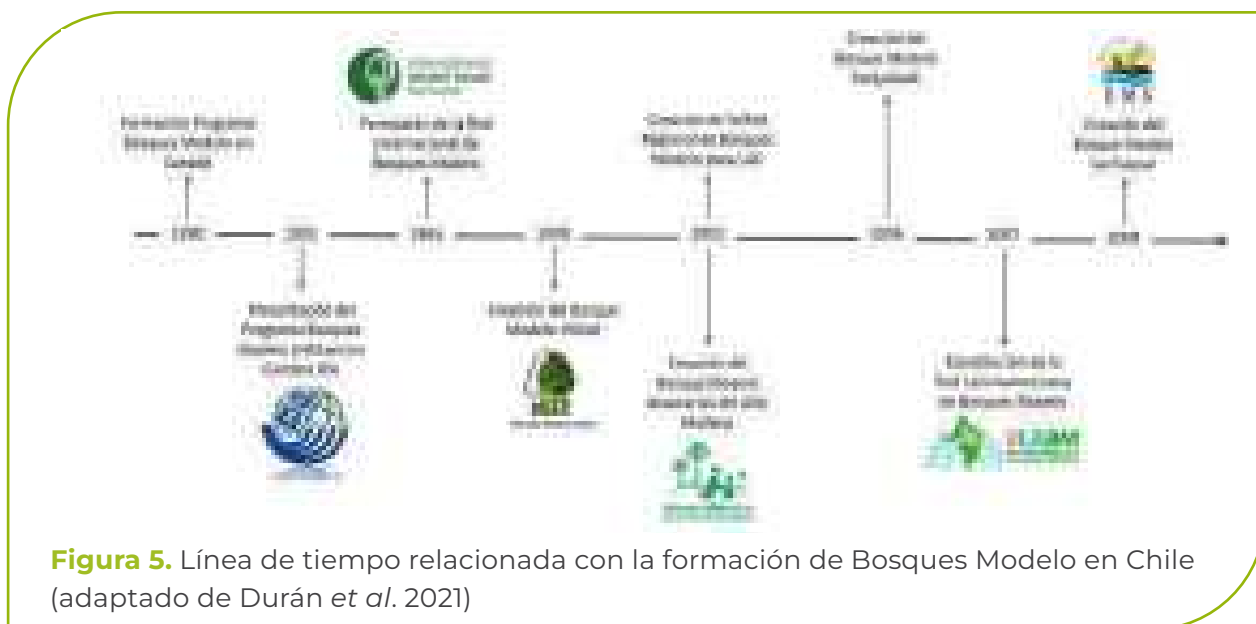
Figura 5. Línea de tiempo relacionada con la formación de Bosques Modelo en Chile (adaptado de Durán et al. 2021)

En el periodo 1998 - 2008, cada proceso se conformó y avanzó en el tiempo en función de oportunidades y desafíos vinculados con cada territorio y el contexto internacional (Figura 5), donde la misión de la Secretaría de la RIBM en América Latina entre 1996 y 1997, facilitó que el servicio forestal chileno (Corporación Nacional Forestal - CONAF), identificara en el concepto una estrategia para fortalecer la gestión forestal (SRIBM 1997). Esto llevó a la formación del Bosque Modelo Chiloé, primer BM en Chile (Bonnell et al. 2012). La conformación de este BM y procesos relacionados con la expansión del concepto llevaron, entre 1998 y 2002, no solo a la conformación de la Red Regional de Bosques Modelo para América Latina y el Caribe (Besseau et al. 2002), sino también al surgimiento del Bosque Modelo Araucarias del Alto Malleco en el 2002.